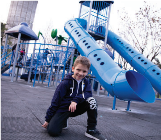
Niños disfrutando de la Plaza Don Pepe ubicada en el Polideportivo.