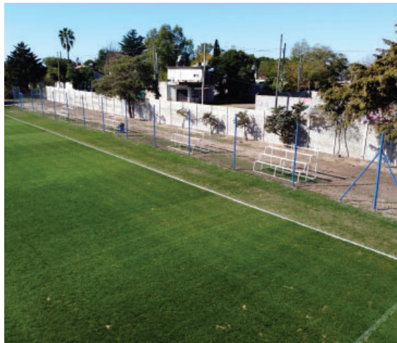
Mantenimiento y remodelaciones en canchas de Fútbol Amateur.