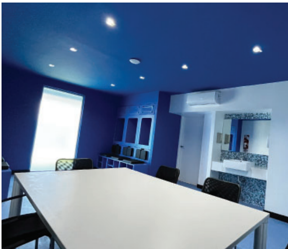
Nuevo vestuario del Cuerpo Técnico del Fútbol Profesional