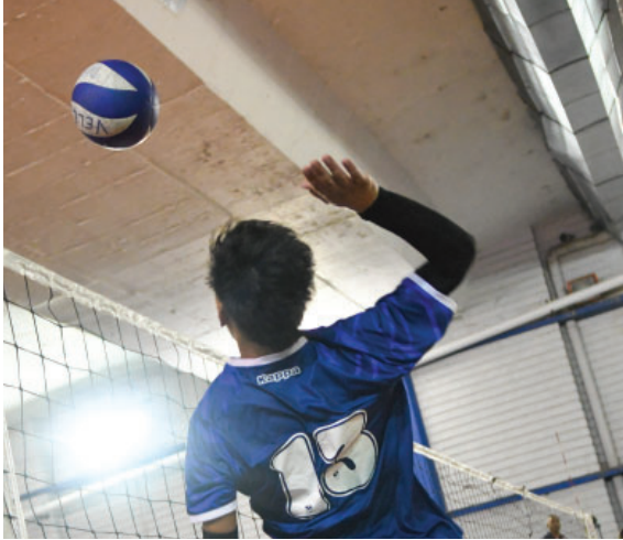
Aprendé Vóley con nosotros.

Ejercicio N° 113 - Del 1 de julio de 2022 al 30 de junio de 2023