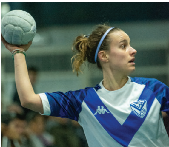
Hacé Cestoball en Vélez y disfrutá del deporte en el Polideportivo.