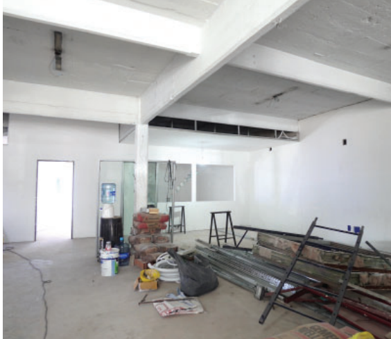
La nueva Obra del CAS (Centro de Atención al socio).