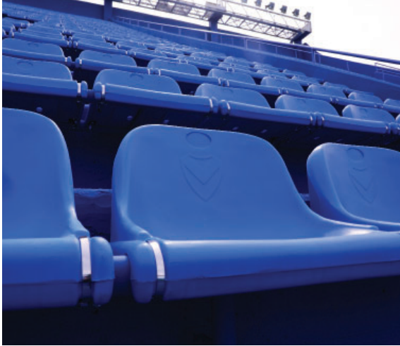
Las nuevas butacas ya colocadas en todo el Estadio.

Ejercicio N° 113 - Del 1 de julio de 2022 al 30 de junio de 2023