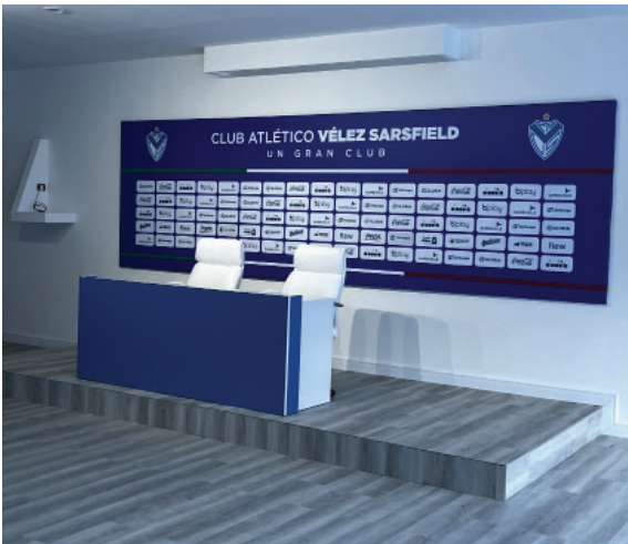
La nueva Sala de Conferencias de Prensa ubicada en el Estadio José Amalfitani.