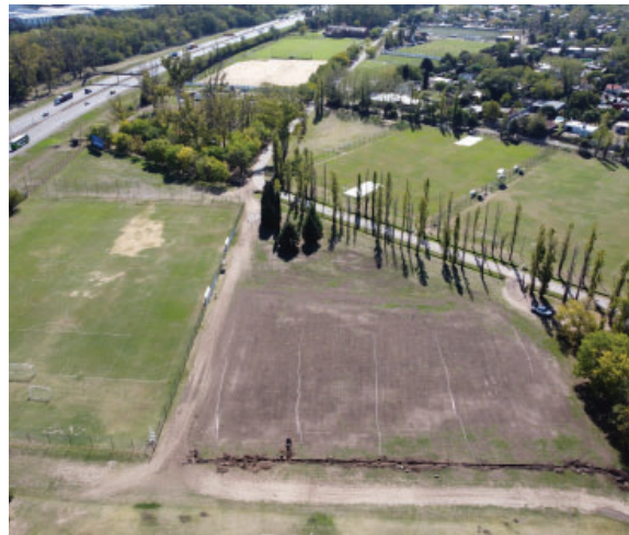
Trabajos de reacondicionamiento en canchas 5 y 6 de Fútbol Amateur de la Villa Olímpica. Obra terminada.