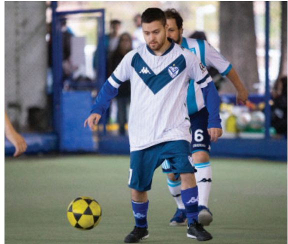
Una de las nuevas propuestas del área de Inclusión. Sumate al equipo de Fútbol Inclusivo en Vélez.