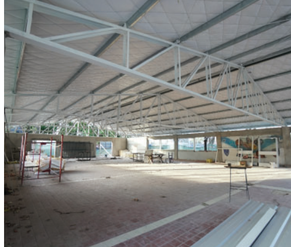
El Quincho del Polideportivo se pone a punto para recibir a los socios.