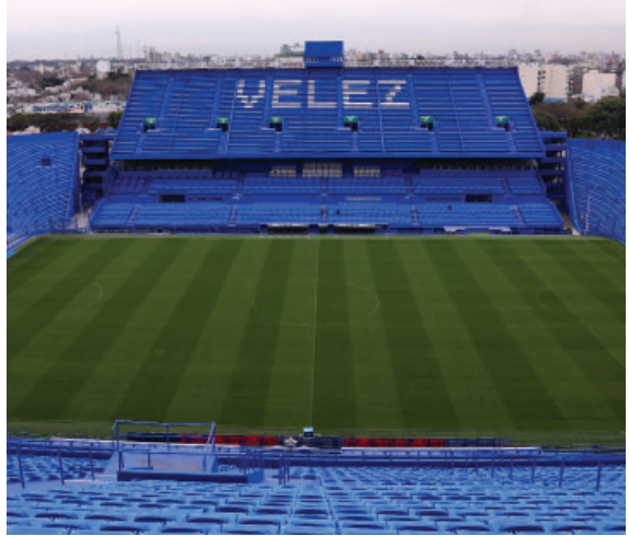
Las butacas formando el VÉLEZ rememorando aquella ocasión en el que el Estadio fue sede del Mundial del '78.