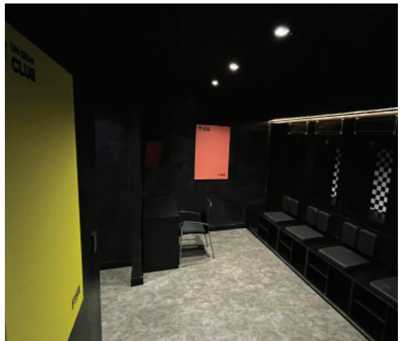
Nuevo vestuario de árbitros