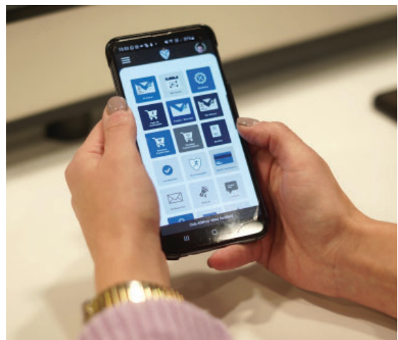
La Nueva App "Mi vélez" llegó para facilitar las gestiones de todos los socios.