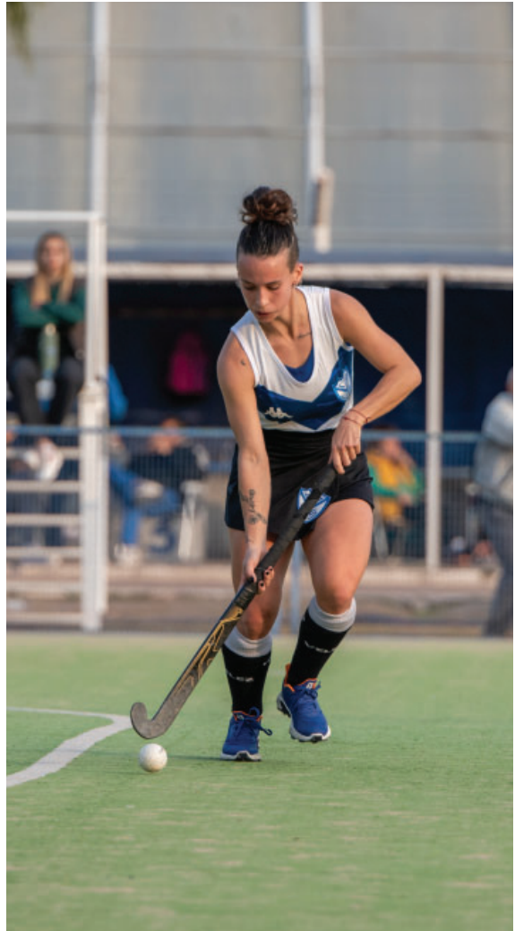
El Hockey sobre Césped Fortinero continúa creciendo cada vez más.