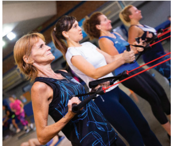
El área de Fitness del Deportivo crece cada vez más.