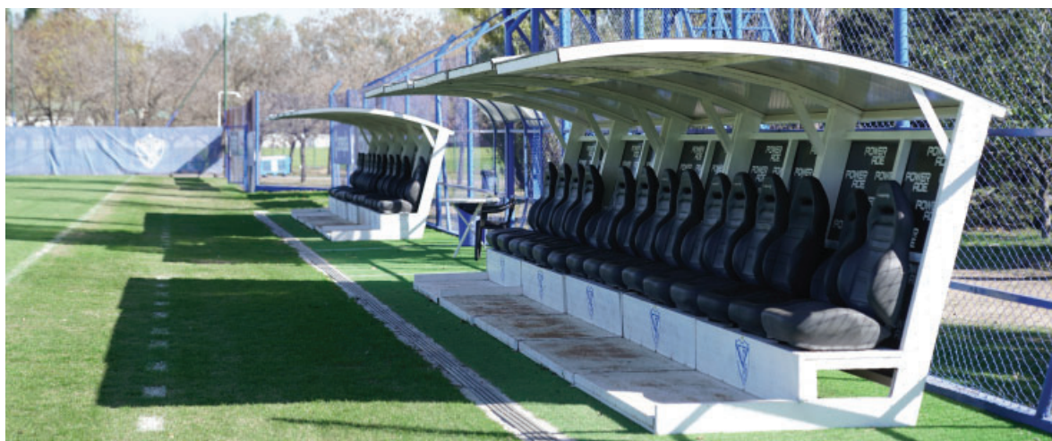
Renovación en canchas de Fútbol Amateur y entorno.