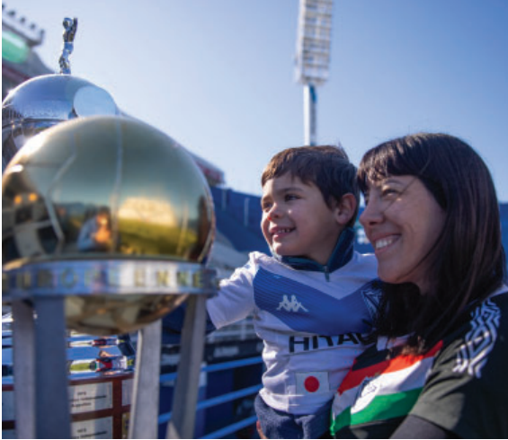
Visitas guiadas de Socios al Estadio José Amalfitani.

Ejercicio N° 113 - Del 1 de julio de 2022 al 30 de junio de 2023