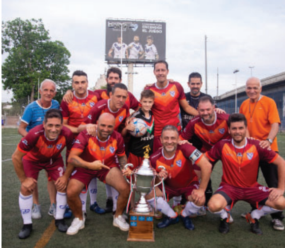
Torneos Internos de mayores en el Campus VS.