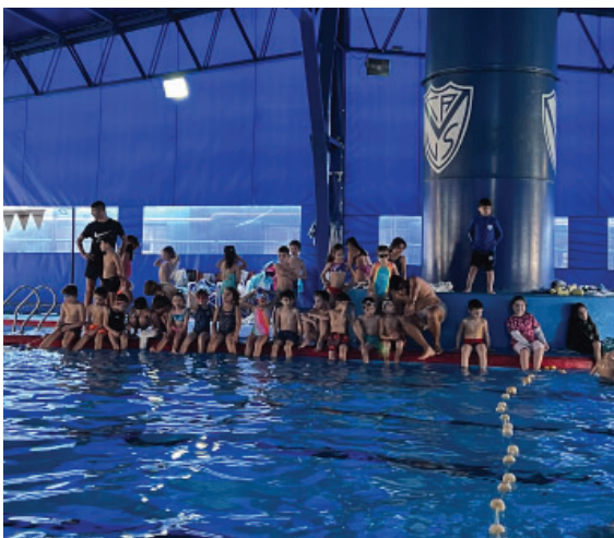
Alumnos del Instituto disfrutando de las clases de Natación en la pileta cubierta.