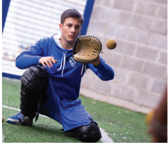
Béisbol, una de las propuestas en pleno auge del Departamento Deportivo.