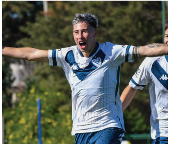
Cada sábado, La Fábrica demuestra todo el potencial de sus jóvenes promesas.