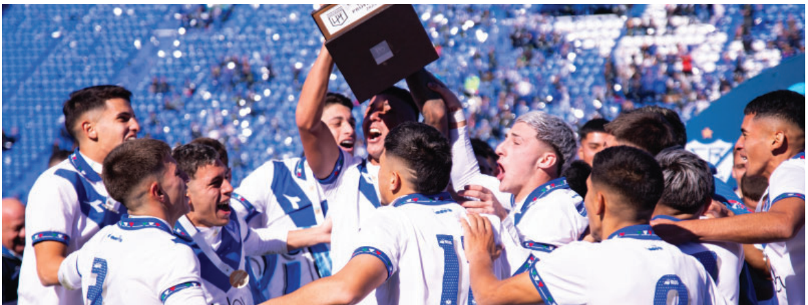
En el Estadio Amalfitani, la Reserva celebró el título luego de 28 años.