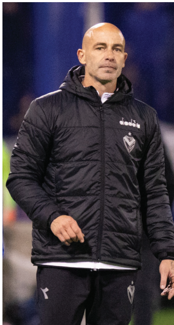
El Gallego Méndez volvió al Club de sus amores cuando más lo necesitábamos.