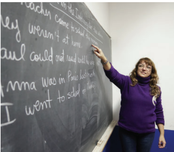
Aprendí Inglés en Vélez.