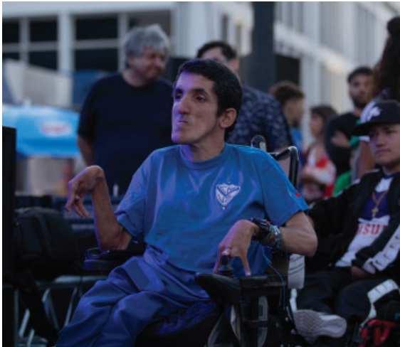
Nuestro equipo de Boccias presente en la Vélez Fest del 2022.