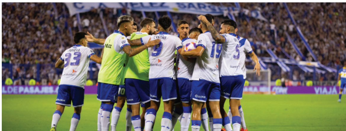
La unión del grupo, componente vital para salir adelante.