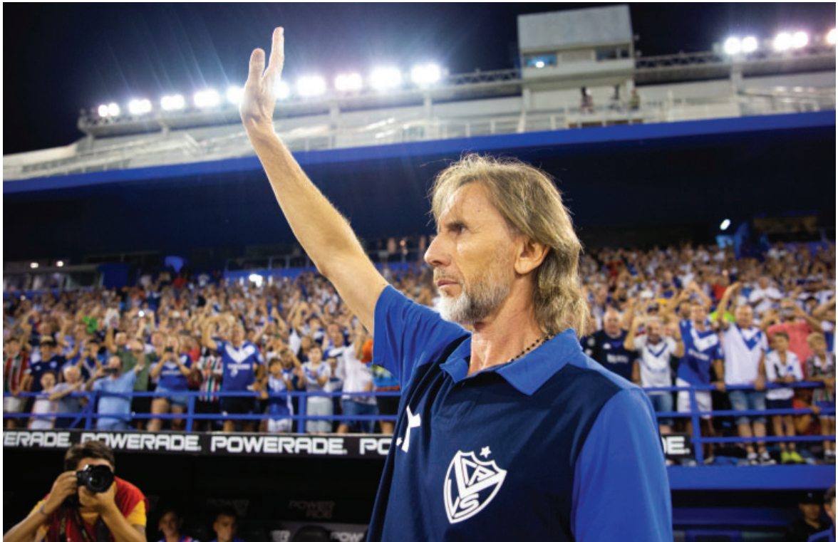
El Tigre en su vuelta a Liniers.