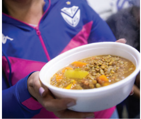
Campaña "Frio Cero" a cargo del área del Departamento Solidario.